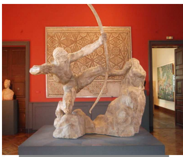
Héraclès archer est la sculpture la plus connue du sculpteur Antoine Bourdelle. Elle représente l'un des douze travaux d'Héraclès, ce lui où il doit abattre les oiseaux du lac Stymphale.

Bourdelle s'est inspiré des travaux d'Héraclès, il a choisi le sixième de ceux-ci : l'extermination des oiseaux du lac Stymphale. Dans la mythologie grecque, les oiseaux du lac Stymphale étaient des oiseaux monstrueux, se nourrissant de chair humaine (selon une des versions), qui infestaient les bois entourant le lac Stymphale, en Arcadie, utilisant les pointes acérées de leurs plumes comme flèches, pour tuer hommes et bêtes et les dévorer. D'autres légendes racontent qu'ils étaient simplement munis de griffes et d'un bec d'airain.