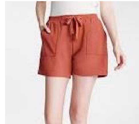
A la limite