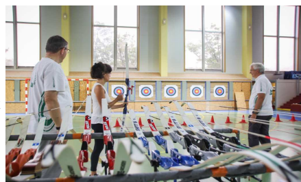
Avant de commencer l'initiation le choix du bon arc est primordial.