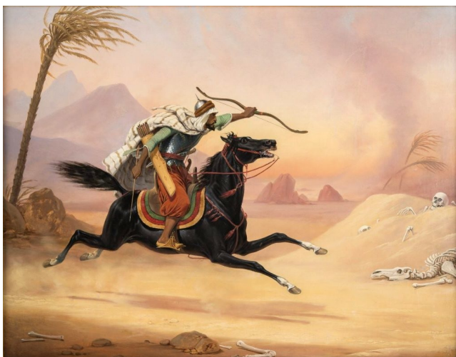
Farys par January Suchodolski (1836)

Dans un numéro précédent nous vous avons parlé du Yabousame où l'art du tir à l'arc à cheval au Japon.