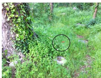
Nouvelle fleur, l'ACE des bois

Fallait pas la perdre comme ça, mais il fallait aussi la trouver.