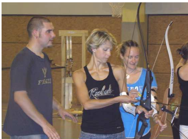
JB, le coach et les Amazones

Quelques séances d'initiation sont donc prévues, d'ici à novembre, avant qu'elles s'envolent pour la Guyane !